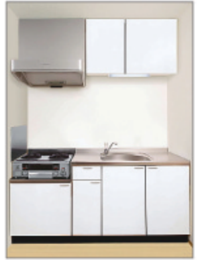
キッチンセット (ガスコンロ付) 幅 1m60cm 以上 本格的な料理も十分楽しめます