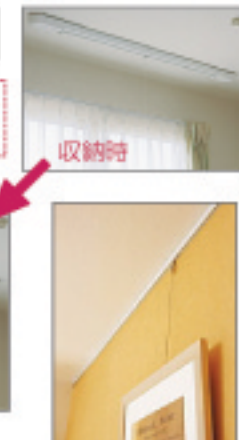
ピクチャーレール