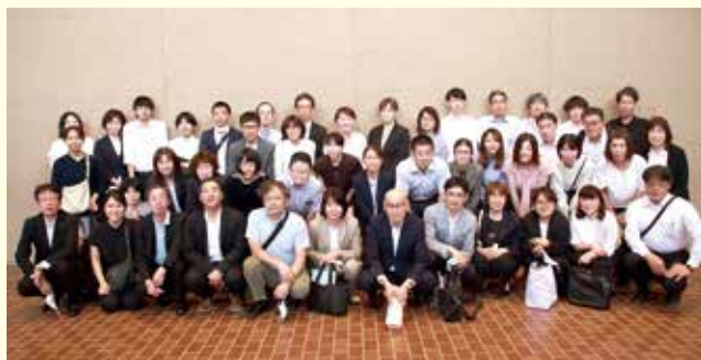
職員一丸となって無事大会を終えることができました