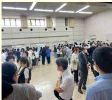
初めての試みとなったポスターセッション